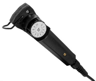
MMA 3 traditionellt fjärreglage för amperejustering