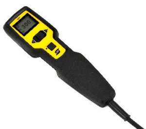
ER 1 multifunktionellt fjärreglage med inbyggd display